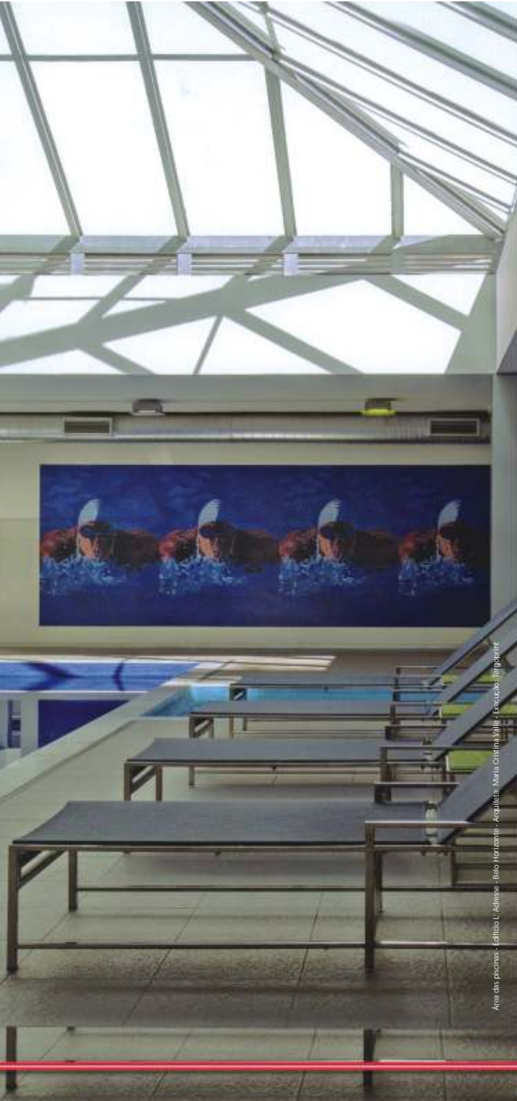
Area das piscinas - Edifício L'Adresse - Belo Horizonte - Arquiteta: Maria Cristina Valle - Execução: Tegoprint