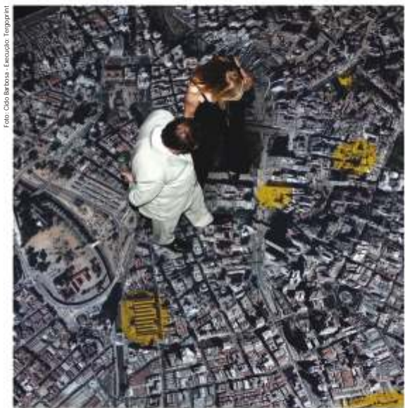
FORMIPISO retrata o mapa aéreo com os principais pontos do centro histórico de São Paulo

Ideal para qualquer estilo de decoração, do contemporâneo ao clássico, FORMICA® COM IMAGEM possibilita a confecção de móveis e projetos personalizados. Além disso, pode ser aplicado em paredes, fachadas externas e em pisos, sejam eles normais, reforçados ou dissipativos, pois o laminado com imagem contém a mesma resistência do piso melamínico da FORMICA® (FORMIPISO).