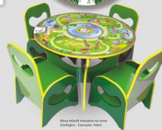
Mesa infantil interativa no tema Zoológico - Execução: Matic